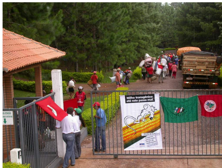
Figura 4 – Movimentos camponeses vinculado a Via Campesina ocupam propriedade da Syngenta.

Os movimentos camponeses e indígenas têm resistido a esse processo, disputando territórios com as empresas capitalistas. No Brasil, a Via Campesina ocupou uma propriedade da transnacional Syngenta como forma de protesto ao processo de territorialização da empresa. Na figura 4, observa-se a ocupação de uma propriedade da Syngenta no município de Santa Teresa do Oeste no Estado do Paraná.