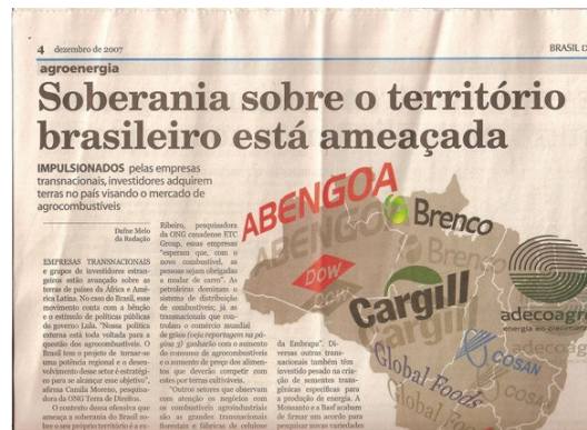
Figura 2 – crítica à territorialização das transnacionais, por meio de compra de terras para o controle do mercado de agrocombustíveis.

Os territórios dos países são disputados pelas empresas transnacionais que controlam ou participam do controle de imensas áreas do primeiro e do segundo território. Dois exemplos podem ser observados nas figuras abaixo.