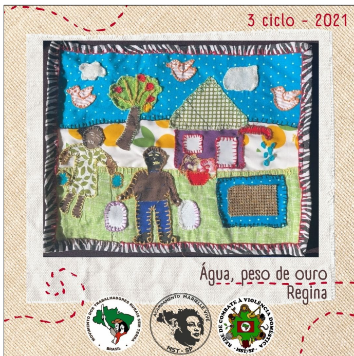
Imagem 9 – Arpillera da sem-terra Regina com o título Água, peso de ouro