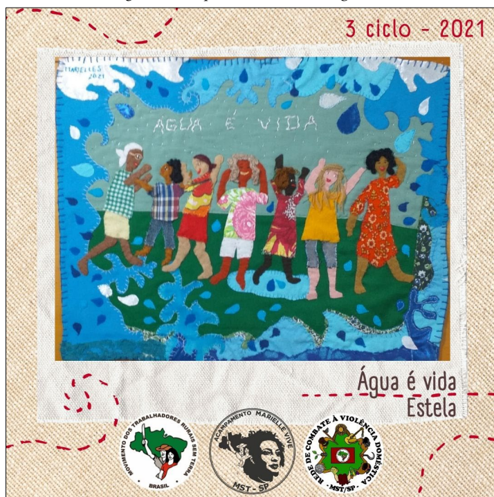
Imagem 10 – Arpillera com o título Água é vida