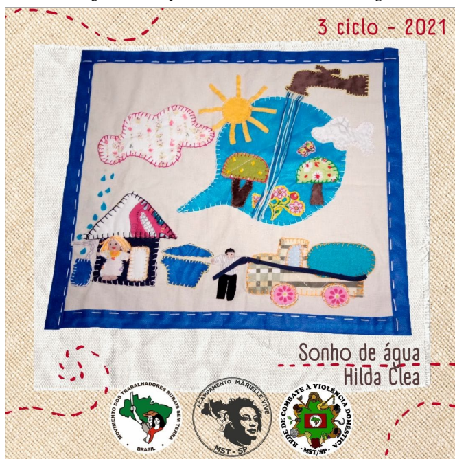
Imagem 11 – Arpillera de Hilda Clea: Sonho de água