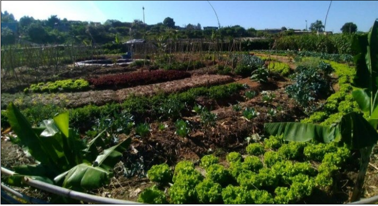
Imagem 6 – Horta Mandala com abundante produção