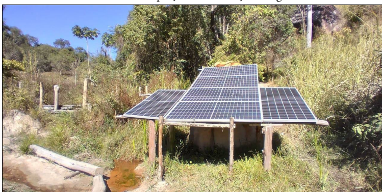
Imagem 3 – Placas fotovoltaicas instaladas para gerar energia ao sistema de captação e distribuição de água