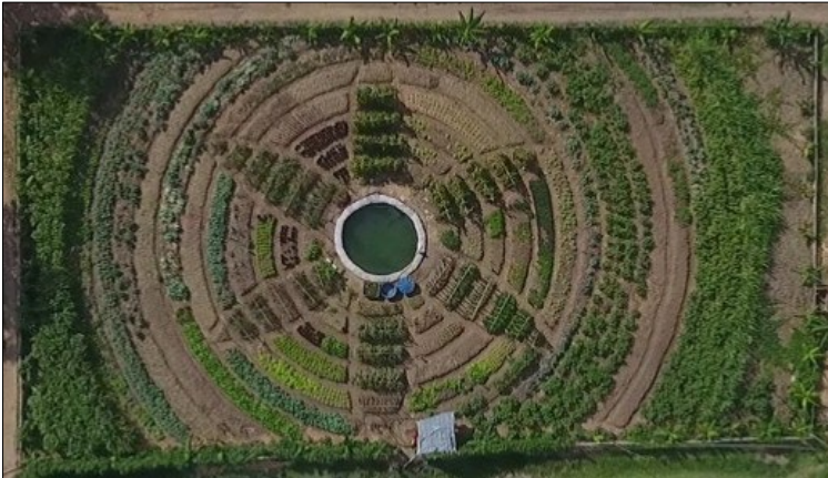
Imagem 7 – Vista aérea da Horta Mandala